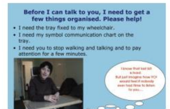
Рис. 3. Одна из страничек коммуникативного паспорта (5)

Прежде чем я смогу говорить с вами, нужно организовать несколько вещей: