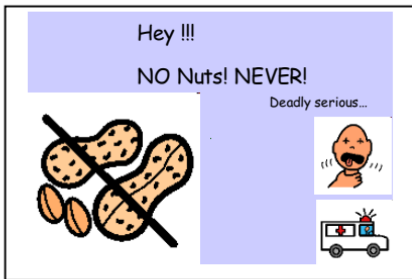
Рис. 3. «Никаких орехов! Никогда! Смертельно опасно!» (5)